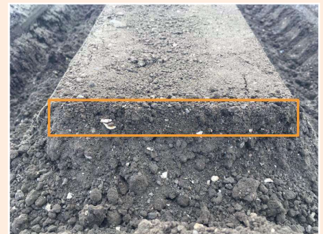
Fijne verkruiemeling toplaag